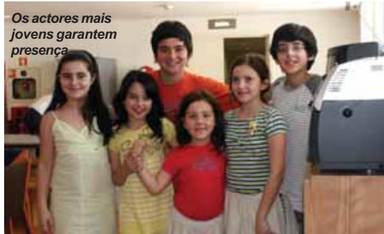
Os actores mais jovens garantem presença